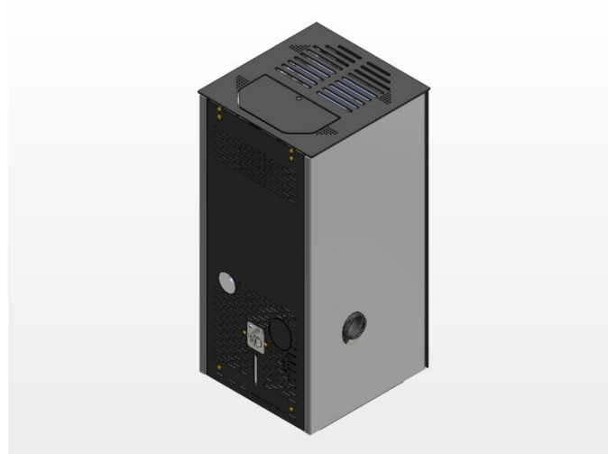
(b) Sortie latérale